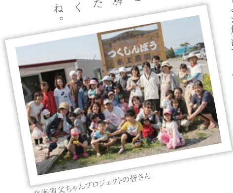
北海道父ちゃんプロジェクトの皆さん

家事・育児に参加すること を会社に理解してもらいた めの環境もつく りたいですね。